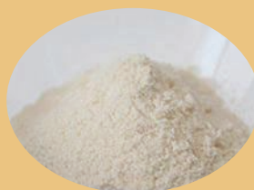
エビデンス豊富なGABA (ギャバ) 原料使用

使用しているGABA原料は、様々なメーカーのものを比較検討し、熱に強く、安全性・有用性、信頼性の高いものを採用しました。見た目も可愛いハート型のパンです。